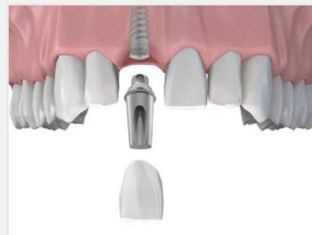
inlocuirea unui singur dinte cu un implant