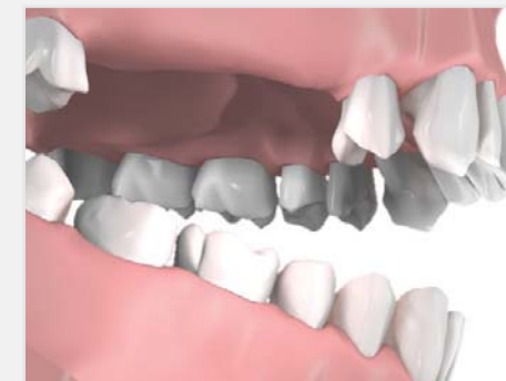
Trei dinti lipsa, osul maxilar