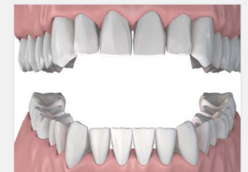
Proteza totala cu capse, rezultat final