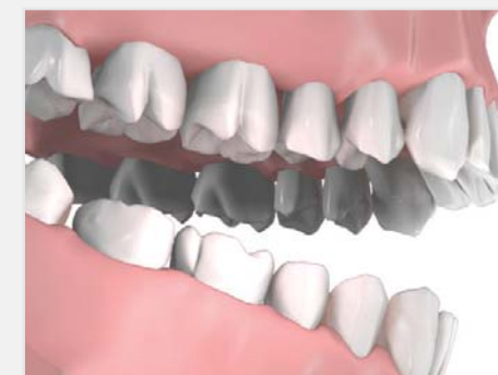
Proteza partiala fixa, rezultat final