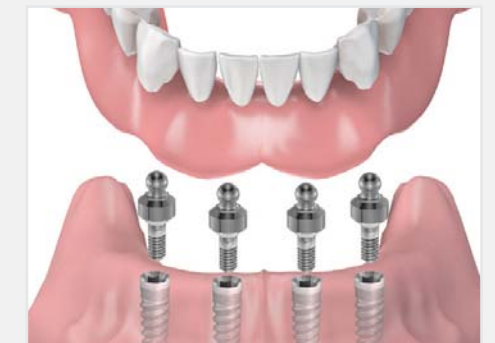
Inserarea protezei totale pe capse