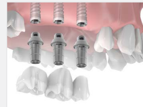
Punte de trei elemente pe trei implante